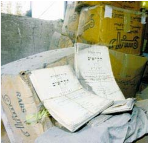
בית הכנסת הקראי בקהיר. מראה כללי כשל טירת רפאים בסרט אימה

מיטל מעריך שהאחראים לביזה הם יהודים מקומיים. כבר בעת שביקר במקום לצורך איסוף החומר להכנת הספר, בתחילת העשור שעבר, שם לב שמסביבו ישנם "אנשים שמאוד לא מרוצים מכך שאני מתעד את הפריטים. בשלב מסוים אסרו עלי להמשיך". דביר יוסף, דובר העדה הקראית בישראל, אומר שהקראים בישראל מודעים היטב לכך "שהרכוש בקהיר לא נשמר בצורה ראויה", אבל ידם קצרה מלהושיע. "בקושי יש לנו תקציב כדי לקיים את הקהילה בישראל", הוא אומר.