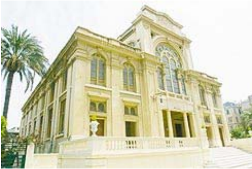
בית הכנסת באלכסנדריה. נחשב לגדול במזרח התיכון אבל נראה כמקום שוקק חיים שהיה למוזיאון

העצמאות בישרו את תחילת הקץ של היהדות המצרית. "יציאת מצרים השנייה" החלה ב-48' ותוך שנתיים עזבו שליש מהיהודים. האחרים שקיוו שסיום המלחמה יחזיר את חנם בעיני המצרים התבדו עד מהרה. שלטונות מצרים שהוציאו את הציונות מחוץ לחוק הבטיחו הגנה ליהודים שיישאו מצרים נאמנים, אבל לא תמיד עמדו בכך. ב-26 בינואר 1952, לדוגמה, נמנעה המשטרה מלהתערב במהומות בקהיר שבהן נרצחו עשרות יהודים והוצתו מלון "שפרד", בית הקולנוע "מטרו" ועוד עשרות עסקים בבעלות יהודית.