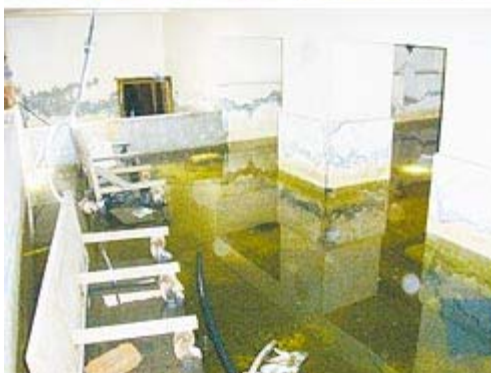
בית הכנסת על שם הרמב"ם בקהיר. בגומחת ה"קבר" של הרמב"ם ניתן לחזות היום רק בצלילה